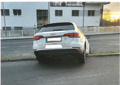
Verkehrsunfall All In 31.12.2022, 07.40 Uhr