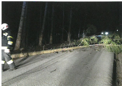
Unwetter Gschwendt 30.01.2022, 17.47 Uhr