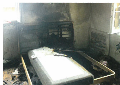
Zimmerbrand Hermsdorf 03.10.2022, 10.54 Uhr