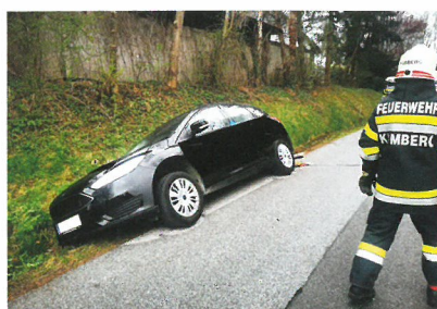
Verkehrsunfall L356 26.04.2022, 16.31 Uhr