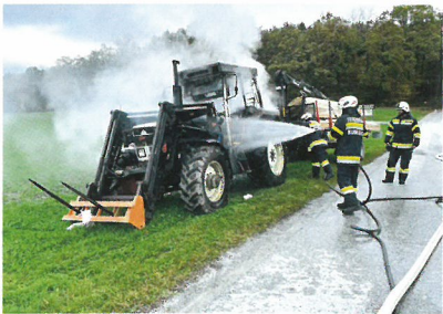
Traktorbrand Meierhöfen 03.11.2022, 10.27 Uhr