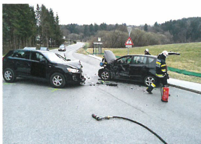
Verkehrsunfall Hauptstraße 30.03.2022, 15.20 Uhr