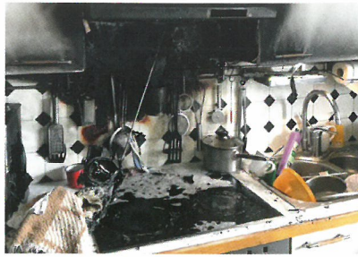
Küchenbrand Birleitenweg 17.03.2022, 15.05 Uhr