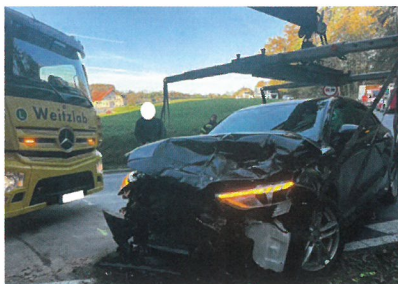
Verkehrsunfall B72 17.10.2022, 06.23 Uhr