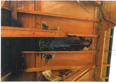
Carportbrand Frindorf 12.04.2022, 15.24 Uhr