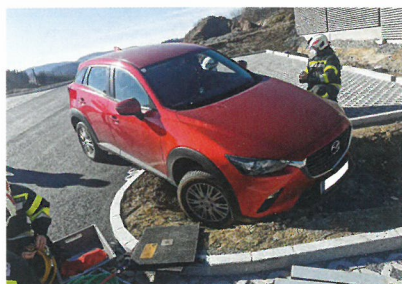
Verkehrsunfall Friedhof 13.02.2022, 12.10 Uhr