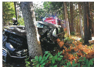
Verkehrsunfall Hofstätten 10.09.2022, 08.45 Uhr