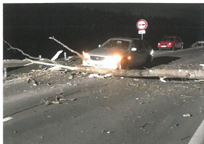
Verkehrsunfall B72 17.01.2022, 19.36 Uhr