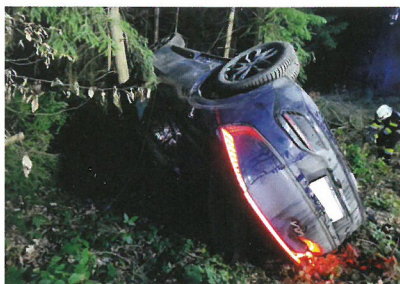
Verkehrsunfall am Würzelberg 26.12.2022, 16.19 Uhr