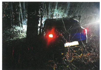
Verkehrsunfall B72 16.03.2022, 22.10 Uhr