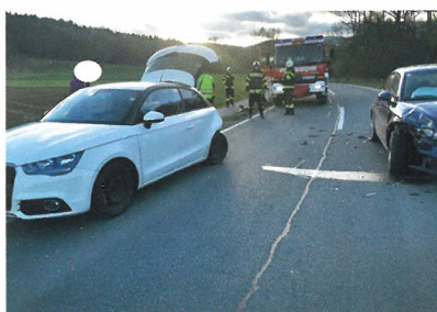
Verkehrsunfall L364 16.04.2022, 18.51 Uhr