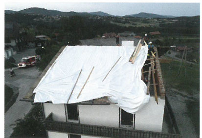
Unwetter Hofstätten 18.08.2022, 16.42 Uhr