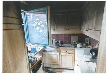
Küchenbrand Prellerberg 01.01.2022, 13.07 Uhr