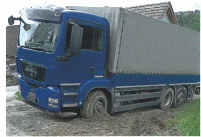
Verkehrsunfall Wollsdorfstraße 25.05.2023