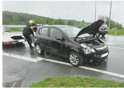
Verkehrsunfall Bachwirt 16.05.2023