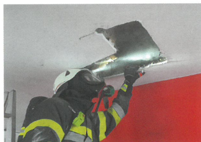
Brand Rabnitz 04.08.2023