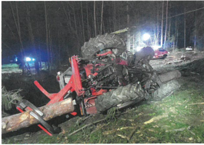
Traktor umgekippt 07.01.2023