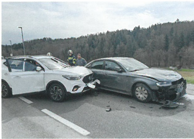
Verkehrsunfall Hammerkurve 30.03.2023