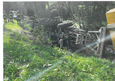
Traktor umgekippt 14.10.2023