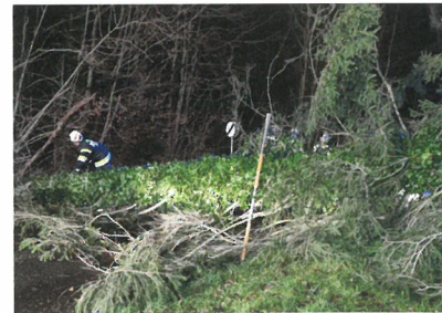
Unwetter Kumberg 23.12.2023