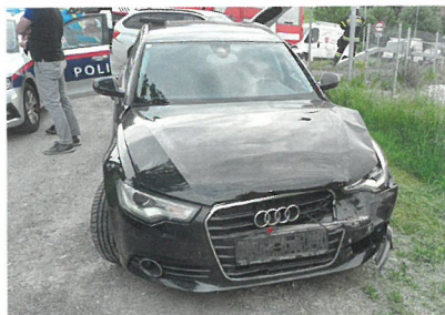
Verkehrsunfall Weizerstraße 31.05.2023