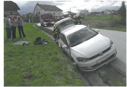
Verkehrsunfall Gschwendt 16.04.2023