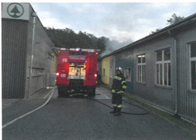
Brand Fa. Fasching 02.06.2023