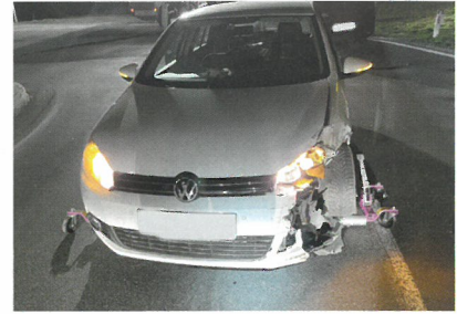
Verkehrsunfall Hammerkurve 05.03.2023