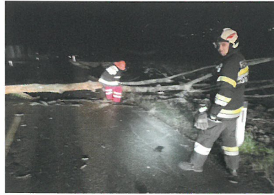
Unwetter Rabnitzbrücke 31.01.2023