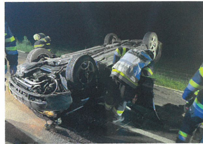
Verkehrsunfall Weizerstraße 23.06.2023