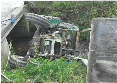
Traktorunfall Kumberg See 29.04.2023