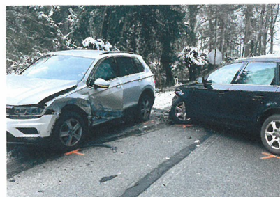
Verkehrsunfall L319 05.12.2023