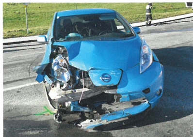
Verkehrsunfall Hauptstraße 16.12.2023