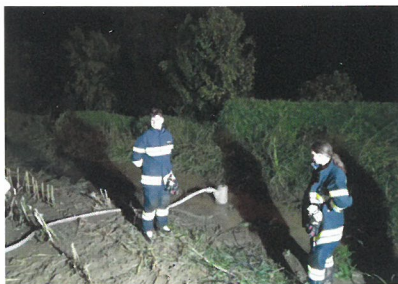
Unwetter Teichweg 13.09.2023