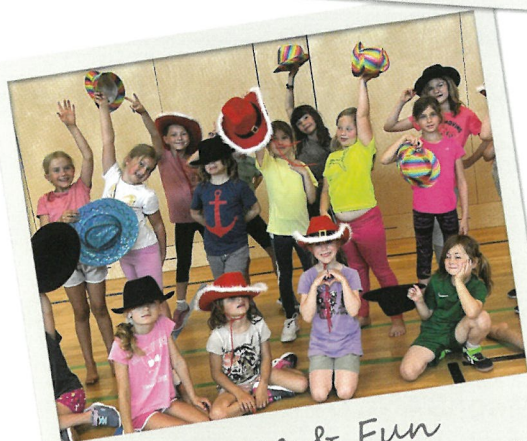
Dance & Fun