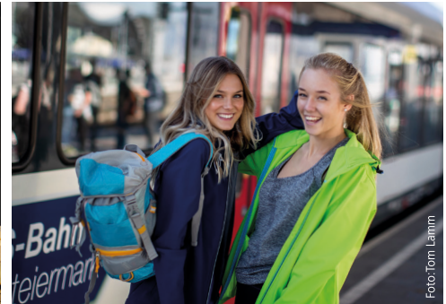
Von Graz aus stehen mit der Eröffnung der Koralmbahn zahlreiche neue und schnelle Verbindungen zur Verfügung. Insbesondere nach Klagenfurt und Salzburg ergeben sich Zeitersparnisse.