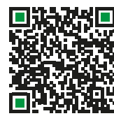
Alle Verbindungen in der Bus-Bahn-Bim-App