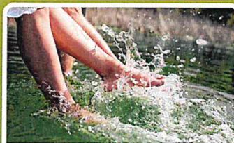
KNEIPP- & WASSERERLEBNIS